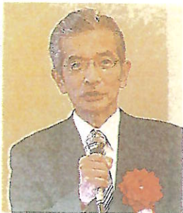
国家財政の状況を説明する 矢野康治氏(岐阜市長良、岐阜グランドホテル)

税理士法人TACT高井法博会計事務所(岐阜市打越、高井法博会長)の顧客でつくるTACT経営研究会は21日、例会と新春賀詞交歓会を同市内で開き、元財務直事務次官で神奈川大特別招聘教授の矢野康治